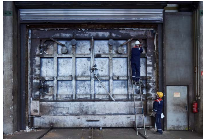
Bild 4: Mit einem XXL-Glühofen und Schweißrobotern war Jebens für die Komplettanfertigung dieser Großbauteile optimal gerüstet.

Gerne senden wir Ihnen diese oder weitere Motive in druckfähiger Auflösung per E-Mail.