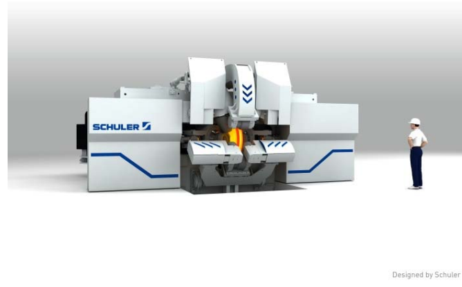
Bild 6: In der Vorformpresse wird der Radrohling mit einer Presskraft von 10.000 Tonnen in zwei Umformstufen geschmiedet.