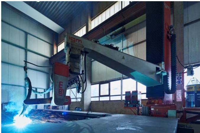
Bild 3: Der Einsatz des Schweißroboters gewährleistete bei mehrlagigem Schweißen mit absolut gleichmäßigen und fehlerfreien Schweißnähten die geforderte Nahtpräzision.