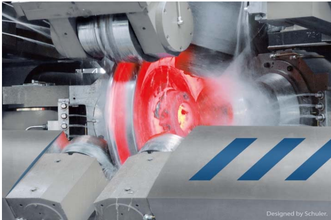
Bild 5: Von der Vorformpresse gelangen die Rohlinge zum Kernstück der Schmiedelinie, der Radwalze. Sie gibt dem Rad seine endgültige Form.

Präzisionspressenlinie bringt Eisenbahnräder für Hochgeschwindigkeitszüge in Form