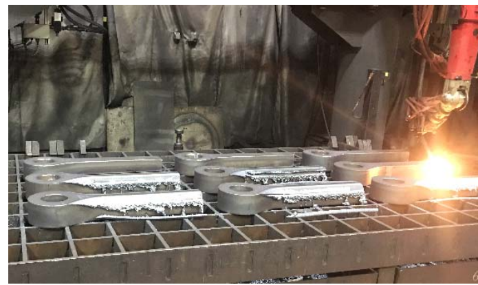
Bild 4: Die Bearbeitung der 200 Millimeter dicken Bleche aus Feinkornstahl S690 für die Gabelköpfe der Liebherr-Hydraulikzylinder erfordert von Jebens präzise Temperaturführung.