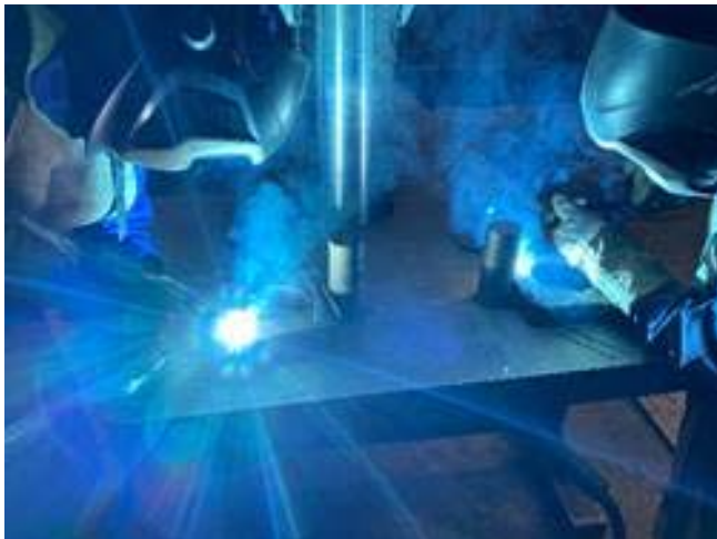
Bild 7: Für Sonderkonstruktionen oder Prototypen von Spur-, Lenk- oder Kolbenstangen ist die langjährige Erfahrung der geprüften Schweißer und Schweißfachingenieure von Jebens gefragt.

Das Bildmaterial darf ausschließlich für den hier genannten Text der Jebens GmbH verwendet werden. Jede darüber hinausgehende, insbesondere firmenfremde Nutzung, wird ausdrücklich untersagt.