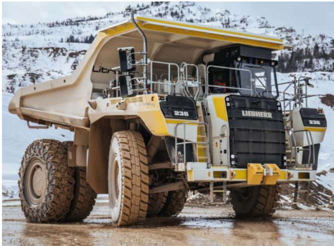
Bild 1: Jebens fertigt Spurstangenrohteile für die Hinterachse der Liebherr-Miningtrucks, die mit 930 Millimetern Länge und 110 Millimetern Dicke zur Stabilisierung der Achsen dienen.

Bei Sonderkonstruktionen für Hydraulikzylinder baut Liebherr auf Jebens