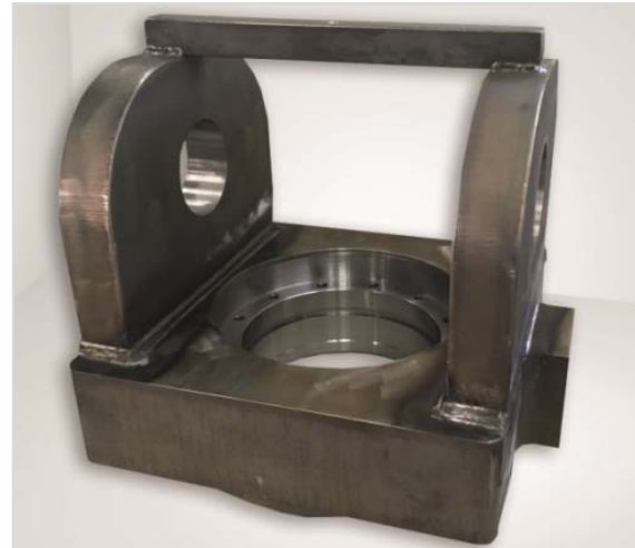
Bild 6: Die von Jebens gefertigten Gabelköpfe werden beispielsweise für den Prototypen eines Mobilkran-Ausschiebezylinders verwendet.