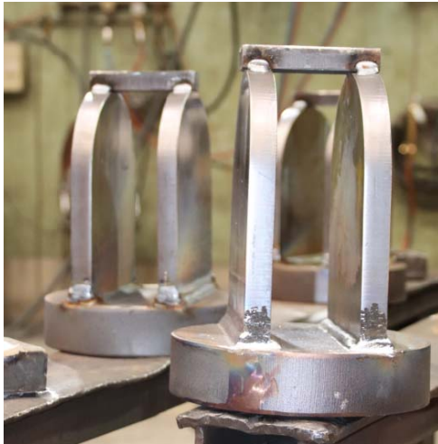
Bild 5: Jebens fertigt Gabelköpfe in unterschiedlichen Abmessungen für Liebherr.

Bei Sonderkonstruktionen für Hydraulikzylinder baut Liebherr auf Jebens