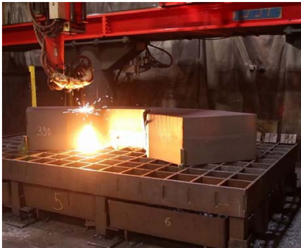
Bild 3: Jebens schneidet die bogenförmigen Brennteile mit sechs unterschiedlichen Fasen so präzise, dass diese Bauteile engste Toleranzvorgaben erfüllen.