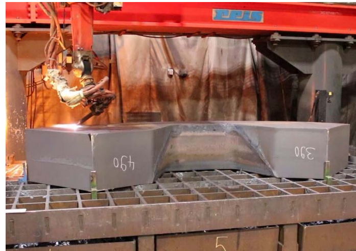
Bild 4: Die Materialstärke S355J2 + N mit APZ 3.1 erforderte eine besonders aufwendige und sensible Temperaturführung.