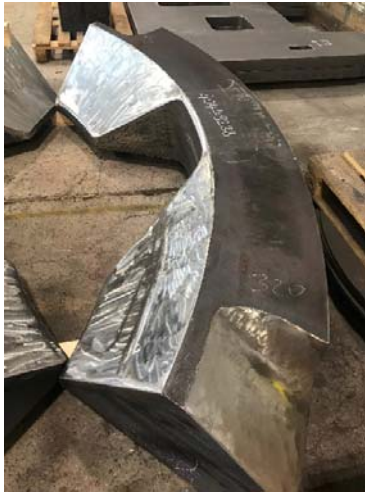
Bild 1: Hohe Brennschneidkunst von Jebens in 400 Millimeter Blechdicke.