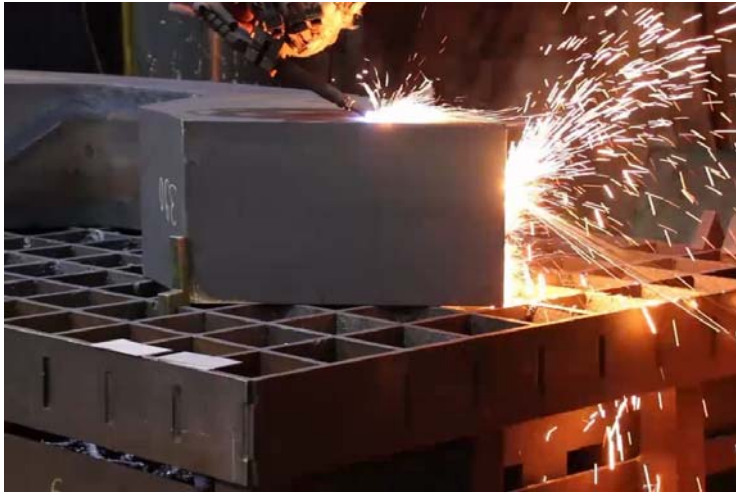
Bild 5: Jebens brachte in der bogenförmigen Bauteilkontur sechs Fasen in unterschiedlichen Ebenen nach Zeichnung an.