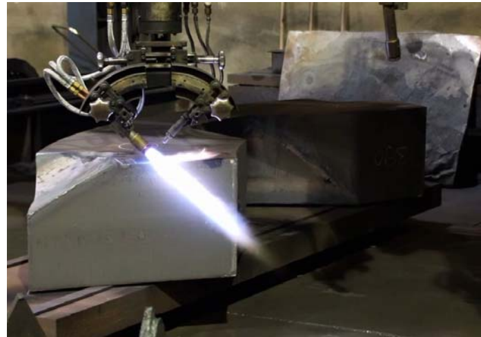
Bild 6: Seitlich wurden 45 Grad Fasen in zwei Ebenen geschnitten.