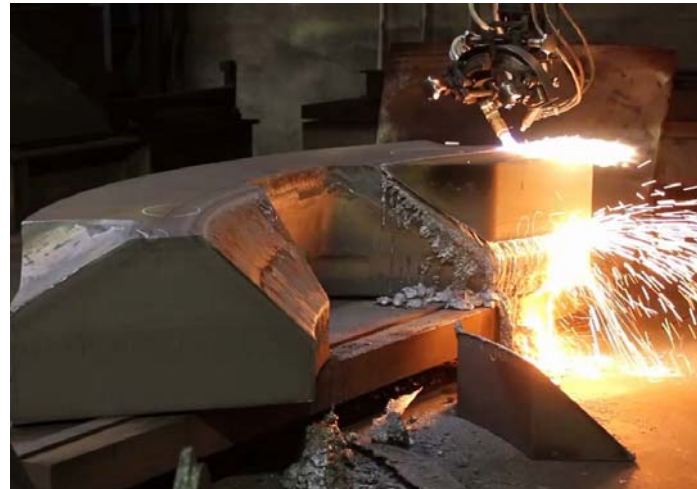
Bild 8: Jebens realisierte die extremen Konturen der Bauteile binnen drei Wochen mit der gebotenen Präzision.