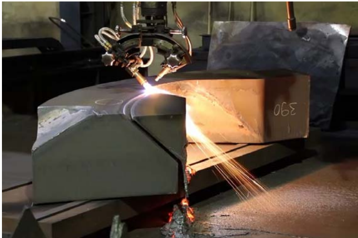
Bild 7: Angesichts der vorgegebenen engen Toleranzen bei dieser Blechdicke waren die geforderten Schnittschräge und -qualität dieser Fasen hohe Kunst.